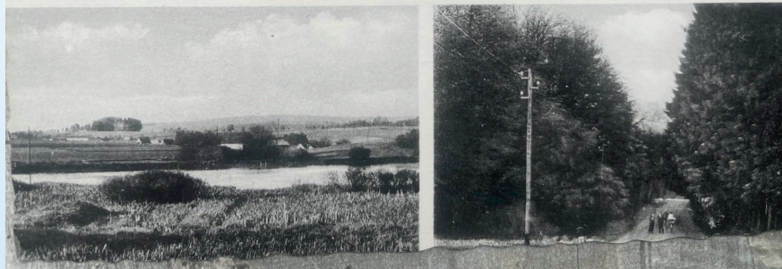
Postkarte: Giershofen früher