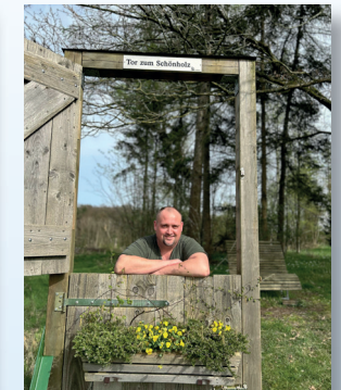
Jens Krunkel