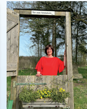
Nicole Vietze