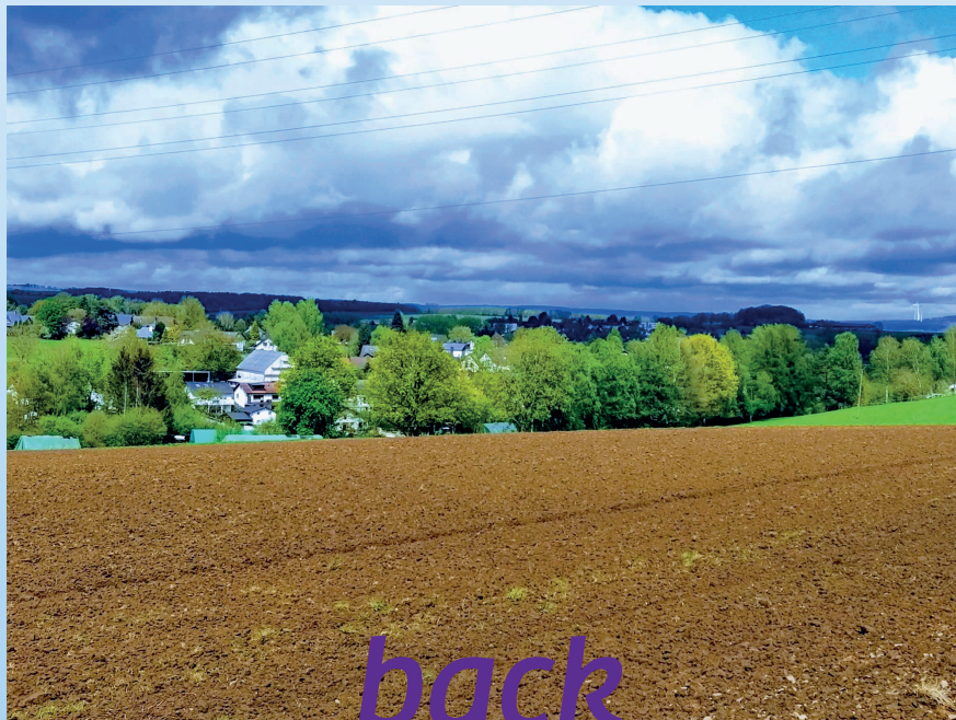
Giershofen heute